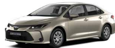
587 Бежевий металік 2