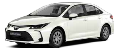
070 Білий перламутр