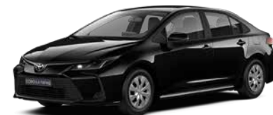
209 Чорний металік