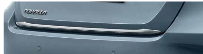
Хромована накладка кришки багажного відділення