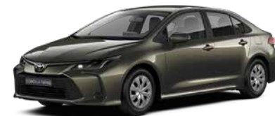
6X1 Бронзовий металік 2