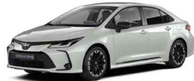
1K6 Сірий металік 1

1 - тільки для GR Sport 2 - окрім GR Sport