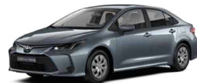
1K3 Сіро-блакитний металік