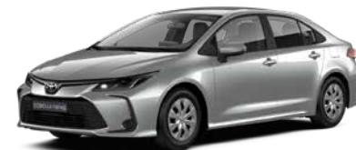
1F7 Сріблястий металік