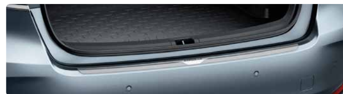
Накладка заднього бампера з нержавіючої сталі