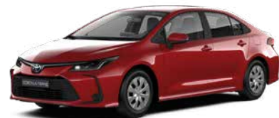
3U5 Червоний перламутр