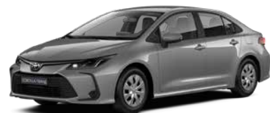
1K0 Сірий металік