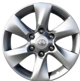
Легкосплавні диски 17", сріблясті