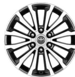
Легкосплавні диски 18", сріблясті з подвійними спицями